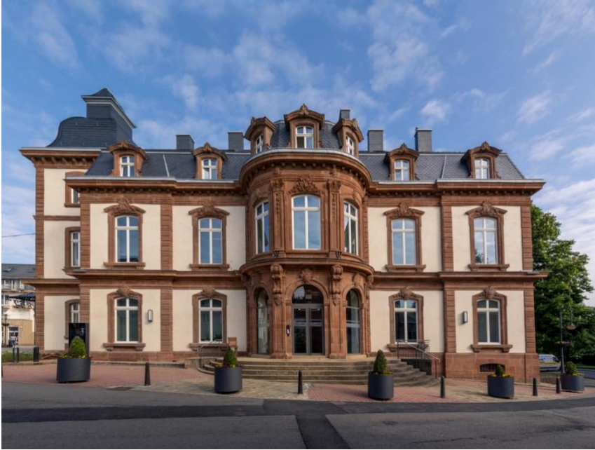
Das renovierte Rathaus in Wiltz

Die Renovierung des historischen, denkmalgeschützten Rathauses wurde ebenfalls nach den Prinzipien der Économie Circulaire durchgeführt. Bei diesem Projekt lag der Fokus auf der Luftqualität, der partizipativen Gestaltung der Arbeitsräume und der Erhaltung der Bausubstanz.