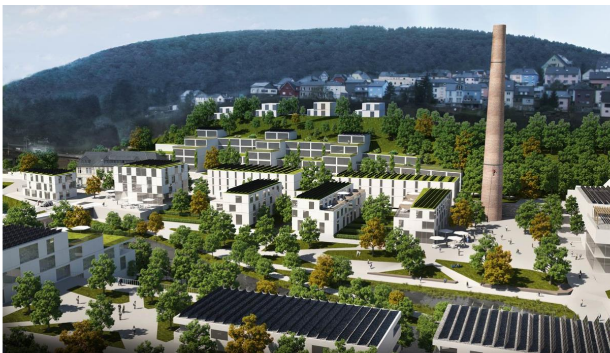
Une simulation 3D du projet « Wunne mat der Wooltz » sur les anciennes friches industrielles

Le projet phare de la ville est le projet d'urbanisation "Wunne mat der Wooltz". Mis en œuvre par le Fonds du Logement, celui-ci vise la construction de presque 1.000 logements et intégrera différents aspects d'économie circulaire, tels que les énergies renouvelables, des bâtiments comme banques de matériaux, des nouveaux concepts de mobilité ainsi que des modèles de partage.