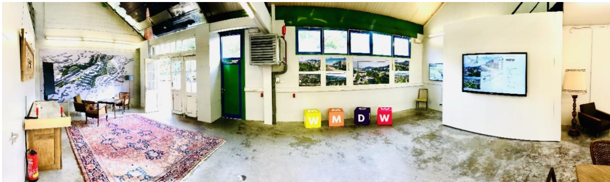
Im HUB wird über die „Circular Economy“-Projekte informiert, die in Wiltz entstehen.

Im „Circular Innovation HUB“ steht hingegen alles im Zeichen der Fortbildung. Hier gibt es Informationen und Aktivitäten rund um die zirkuläre Wertschöpfung.