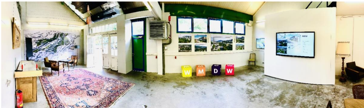
Le HUB est le lieu où sont fournies les informations sur les projets d'économie circulaire en cours de création à Wiltz.

Le « Circular Innovation HUB », quant à lui, est axé sur les formations, l'information et des activités en lien avec l'économie circulaire.