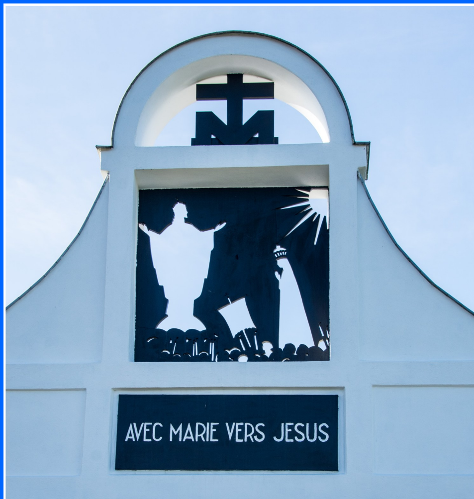
Détail de l'arcade d'entrée au Sanctuaire Notre-Dame de Fátima au lieu-dit "op Baessent"