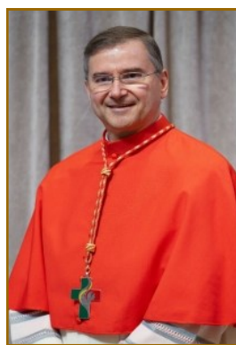
Cardeal D. Américo Aguiar Evêque de Sétubal Bispo de Sétubal