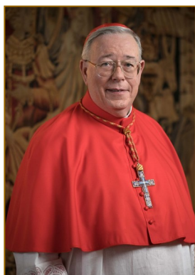
Cardinal Jean-Claude Hollerich sj Archevêque de Luxembourg Arcebispo do Luxemburgo